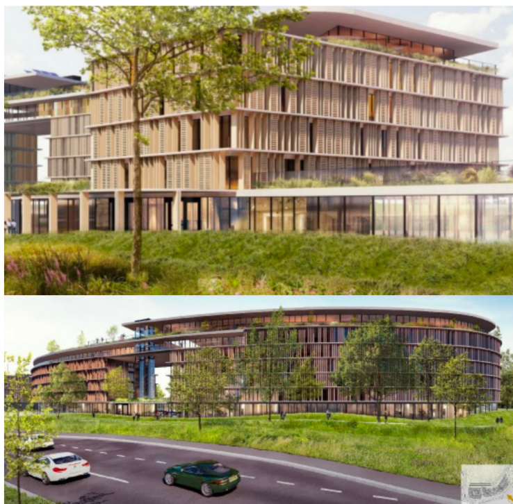
Les futurs hôtels Westin et Alof

Avec notre article publié le 29 novembre 2020, disponible ici , les lecteurs de Roissy Mail ont pris connaissance du premier bâtiment qui s'implantera au sein de la ZAC Sud-Roissy. L'hôtel Eklo, un établissement de 330 lits pour 150 chambres, élaboré par l'Atelier d'Architecture Delannoy & Associés (AADA), et développé par les promoteurs PM3C et AURIEL, devrait accueillir ses premiers clients pour 2022. Son coût est estimé à 4,5 millions d'euros. Dans la continuité, en seconde implantation, deux résidences hôtelières nommées Stay City (265 chambres) et Appart Hôtel (213 chambres), qui comprendra également 400 m 2 destinés à la création d'un restaurant et de commerces, pourraient ouvrir pour 2022-2023. La conception de ces deux résidences hôtelières a été confiée au Groupe d'architecture EAI et au promoteur Océanis , représentant un coût de construction de 19 millions d'euros pour Stay City et 10 millions d'euros pour Appart Hôtel. Ces deux résidences hôtelières tablent sur la création d'une centaine d'emplois.