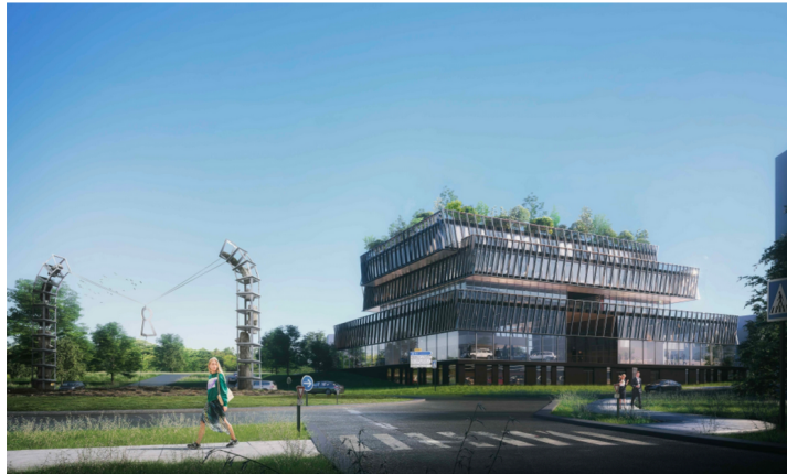
le futur village automobile

Toujours en ce qui concerne l'hôtellerie, la construction de deux hôtels de classe Marriott, Westin et Aloft, qui auront une capacité totale de 280 chambres et disposeront d'un restaurant-terrasse, le Babette-Roof top-Coworking. Ce complexe hôtelier devrait pouvoir créer environ 350 emplois à terme, à lui seul. D'investissement global d'approximativement 180 millions d'euros, ces deux hôtels mitoyens sont imaginés par les bureaux d'architecture Artbuid et développé par le promoteur Groupe Edouard Denis . Aucune date n'est communiquée pour le moment, en ce qui concerne le début et la fin des travaux.